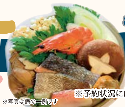
※写真は鍋の一例です

※3名様~ ※5日前まで要予約 ※予約状況に応じてお受けできない場合がございます